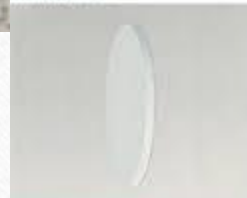
concealed sidewall sprinkler